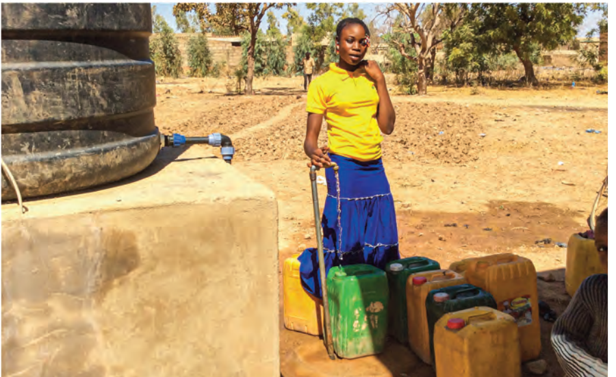
ACQUA, RISANAMENTO, IGIENE