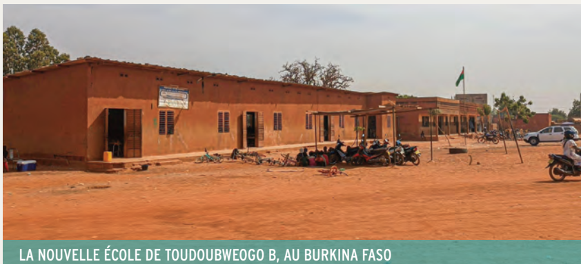
LA NOUVELLE ÉCOLE DE TOUDUBWEOGO B, AU BURKINA FASO

Sana Moussa, une élève burkinabé de 13 ans, témoigne : « la cantine nous permet de bien manger les jours d'école. Les menus sont variés : riz, haricot, couscous, spaghetti... Elle nous évite aussi de longs déplacements à midi et nous permet de réviser ensemble sous les arbres et donc d'avoir de meilleures notes ! »