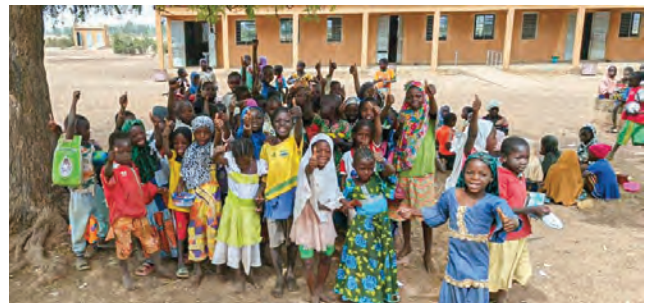
ENFANTS DE L'ÉCOLE TENKODOGO (BURKINA FASO)

À la cantine de Tenkodogo, les enfants se sont mis à danser spontanément au moment où le repas a été servi. Un enfant exprime naturellement ce qu'il ressent quand son besoin est satisfait, c'est beau ! J'ai aussi été très touché par la persévérance d'un apprenant en situation de handicap moteur aux Ateliers. Sa détermination est une vraie leçon de vie.