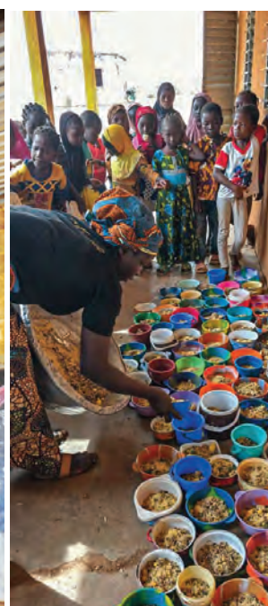
CANTINE DE TENKODOGO