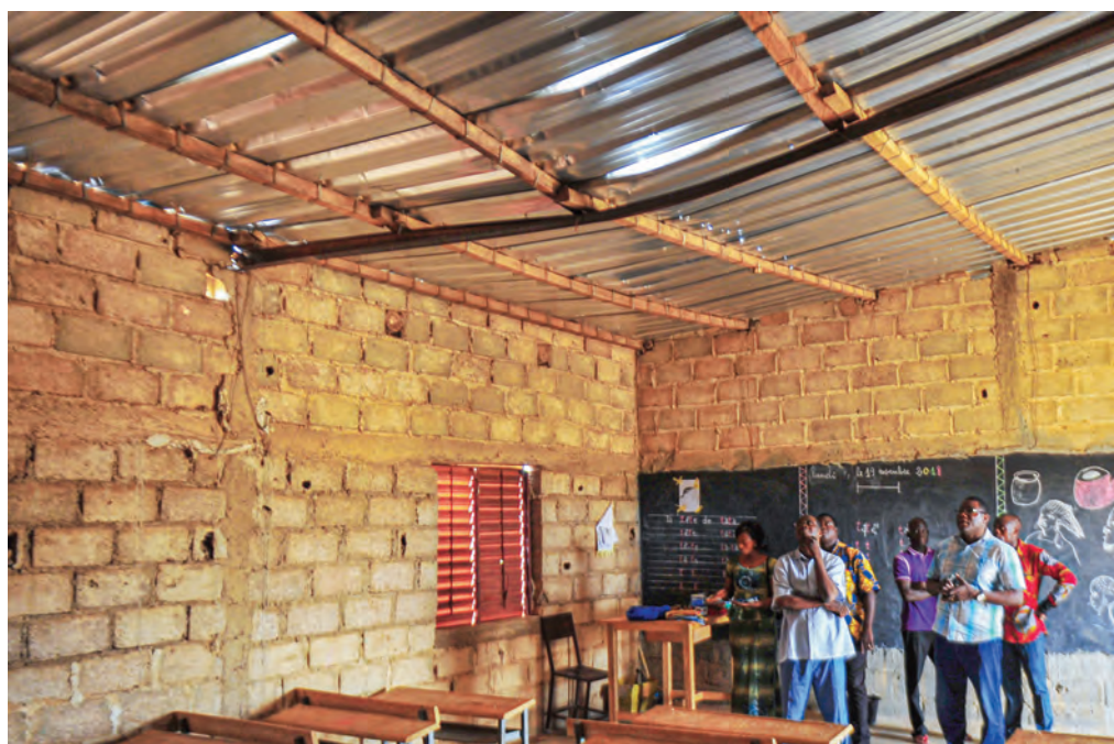
LE TOIT DE L'ÉCOLE DE YAGMA (BURKINA FASO) APRÈS UN COUP DE VENT D'UNE RARE VIOLENCE

En complément des efforts étatiques et locaux, les interventions ciblées de Morija auprès des écoles répondent à des besoins concrets que la seule action publique ne suffit pas toujours à combler : réhabilitation d'infrastructures, accès à l'eau et à l'assainissement ou encore création et soutien de cantines. Ce travail de proximité, adapté aux réalités locales, contribue à renforcer la résilience des communautés éducatives et à offrir à chaque enfant une chance réelle de rester à l'école. ■