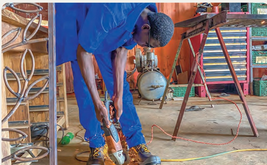
LABORATORI PROFESSIONALI DI PAAM LAFI

Infine, gli apprendisti stessi partecipano a progetti comunitari, ad esempio realizzando sedie a rotelle per il Centro Medico-Chirurgico di Kaya e tende per gli sfollati interni che vivono nei campi. È un modo concreto per loro di restituire ciò che hanno ricevuto. ■