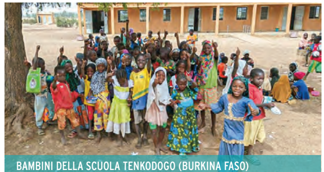
BAMBINI DELLA SCUOLA TENKODOGO (BURKINA FASO)

Alla mensa di Tenkodogo, i bambini hanno iniziato spontaneamente a ballare quando è stato servito il pasto. Un bambino esprime spontaneamente ciò che prova quando un suo bisogno viene soddisfatto: è bellissimo! Sono rimasto molto colpito anche dalla perseveranza di un corsista con disabilità fisica durante i laboratori. La sua determinazione è una vera lezione di vita.